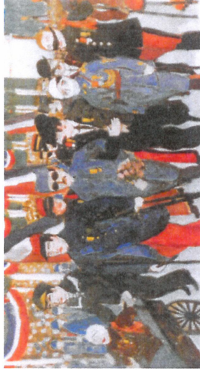
Jean Galtier-Boissière : Le défilé des mutilés. 1919