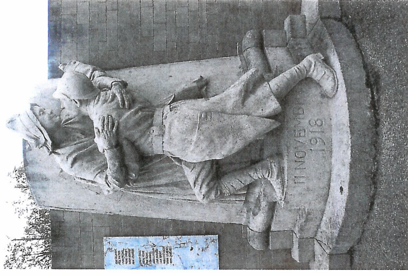
Monument aux morts, Valognes (Manche)

Amphithéâtre du Conseil régional de Normandie à Rouen 5, rue Robert Schuman, Rouen